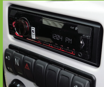
Bluetooth Radio + 2 Lautsprecher