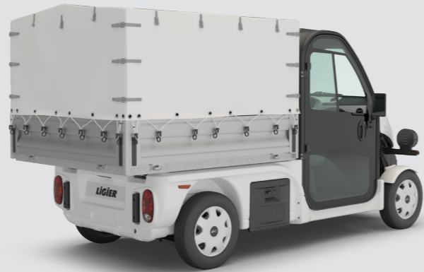
4 Ladefläche + Plane