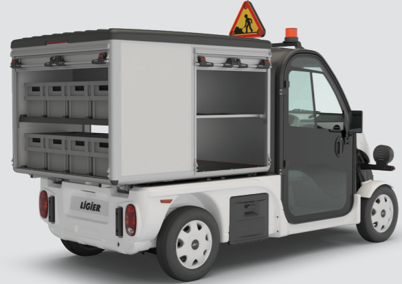
8 LKW mit Rollladen: rechts und/oder links und/oder hinten