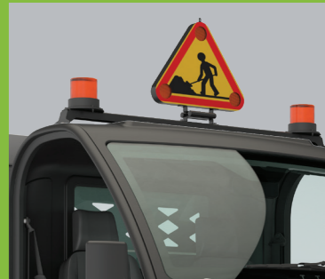
Dachträger + Warnleuchte, -Dreieck