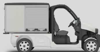
PULSE 4 - LANG