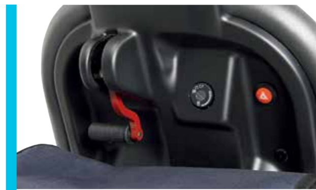
Parkbremse mit automatischer Blockade des Pendelsystems