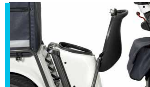
Kofferraum unter dem Sitz mit zweifach 5 V USB Anschluss