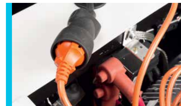
Aufladung an Haushaltssteckdose

Der Pulse 3, 3-rädriges Micro- Nutzfahrzeug. sicher & stabil