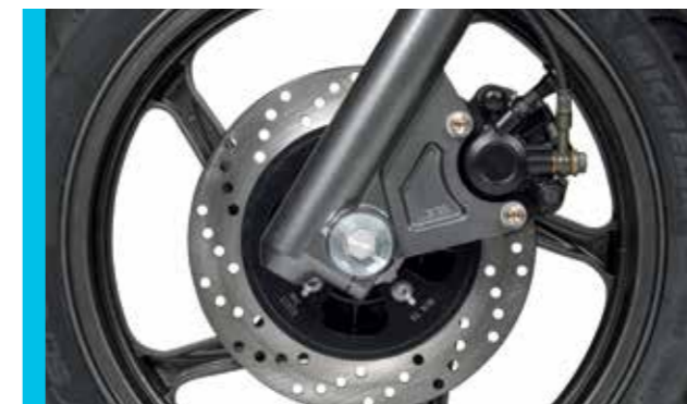
3 hydraulische und belüftete Scheibenbremsen